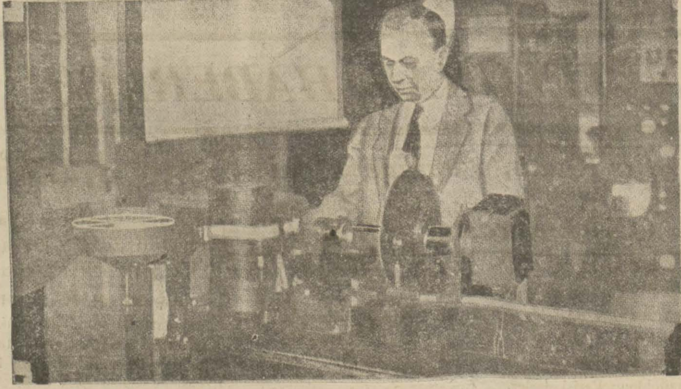
Neuyorkta radyo ile birlikte fotoğraf nakleden makine