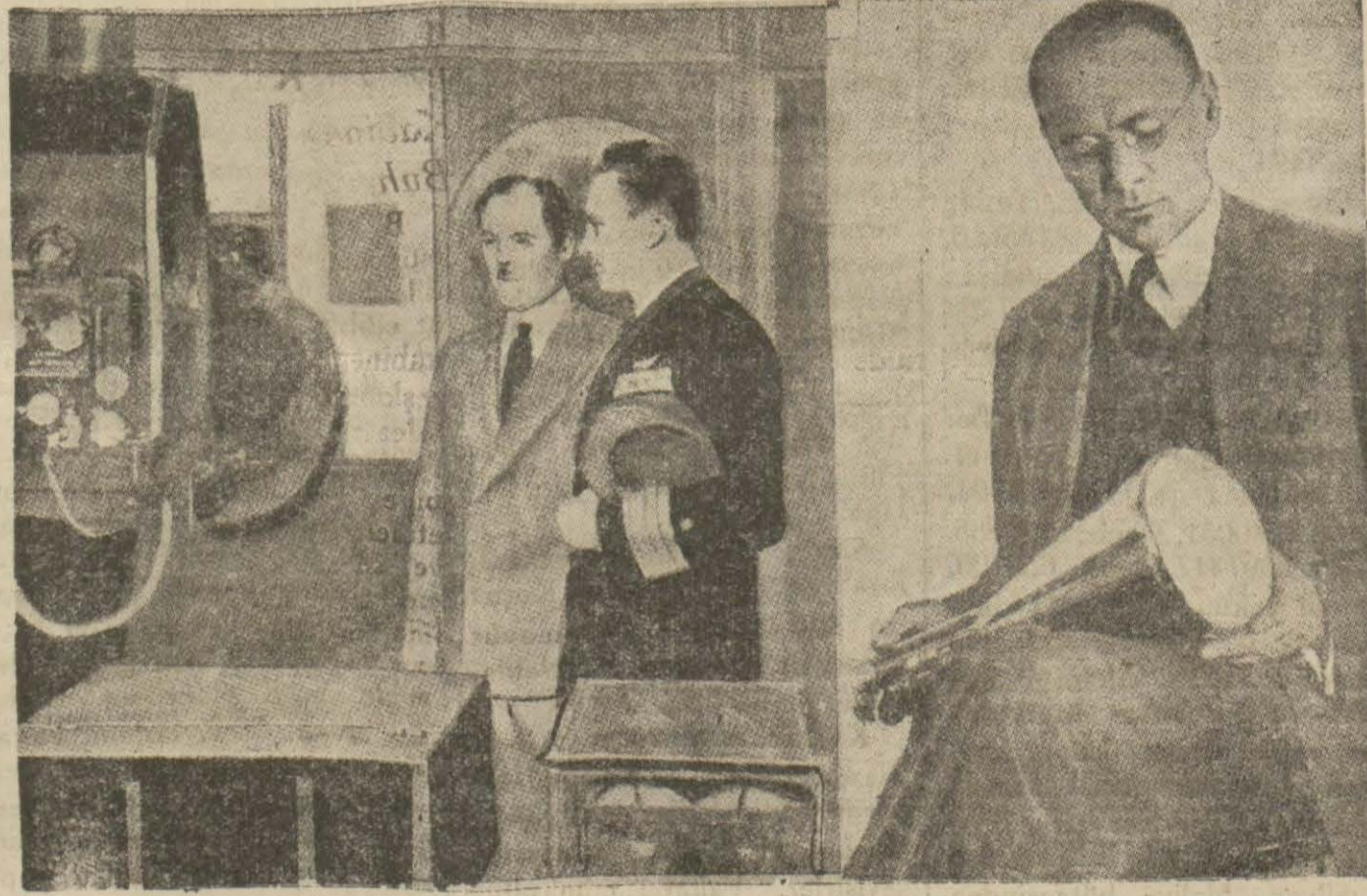
Cenup kutbuna giden Bird Neuyorkta döndükten sonra radyo merkezinde hem söz söylemiş, hem de fotoğrafı nakledilmiştir.