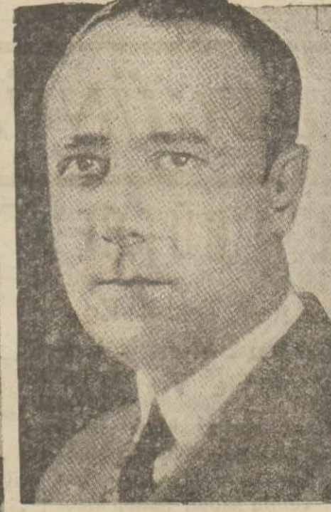
Radyoda fotoğraf naklini temin eden Amerikalı mühendis